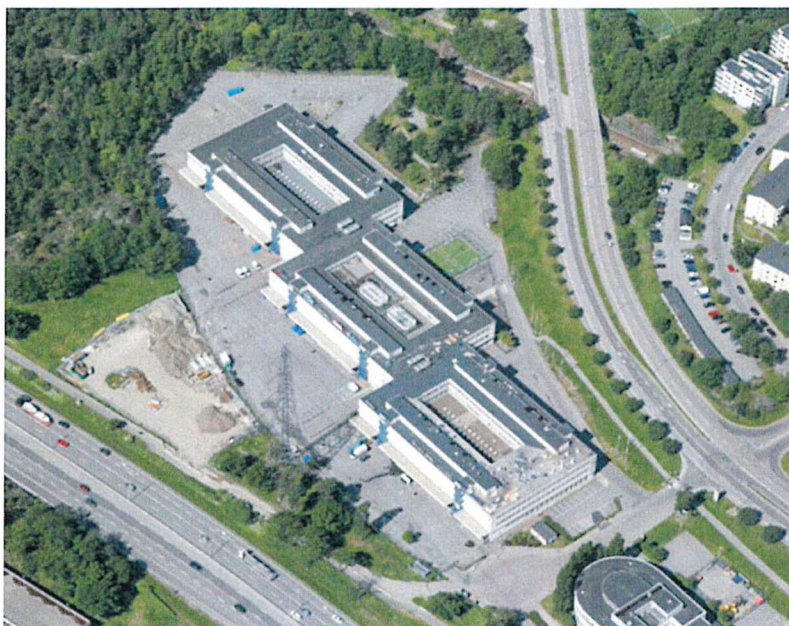
Figur 2: Flygvy från öster med Skärholmsvägen i övre delen och E4/E20 i nedre kanten. Den obebyggda delen av fastigheten består till största delen av hårdgjorda trafikytor.